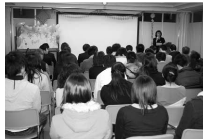
2月7日の春節(旧正月)を祝った

4月からの本格始動に向けて「中国語教育」「市民向け文化イベント」「学術文化」「留学プログラム」「各種コンサルティング」等事業について検討しており、詳細については今後ホームページ等でご案内していく予定です。