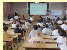
コロナ対策で三密を避けてお聞きしました