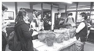
博物館で学芸員の方からお話を聞く(倉敷考古館での見学実習)

博物館において5日間以上の館務実習もを行います。ここでは、学芸員の業務の一端を体験させていただき、資料の取り扱いや展示方法、利用者への対応など実践的な経験や訓練と同時に、学芸員としての責任感や博物館で働く心構えについても学びます。