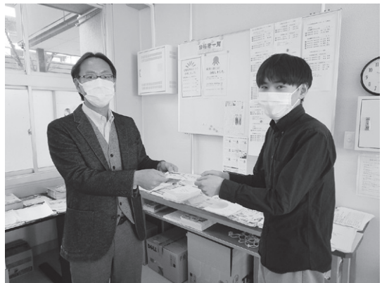
合格報奨金授与の様子

新型コロナウイルスの影響で思うように学生生活を送れないなか、早くから進路について考え、資格取得を目指す学生が増えているように思います。商大塾では、資格取得を目指す学生への支援を行っています。（商大塾）