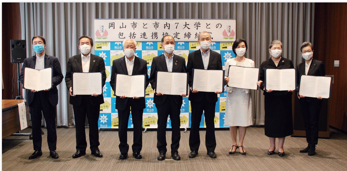
岡山市と市内大学との包括的な連携協力に関する協定締結式(令和3年8月30日(月)10時～・於:岡山市役所) ※左から4番目が大森市長、左から3番目が本学大崎特別顧問。