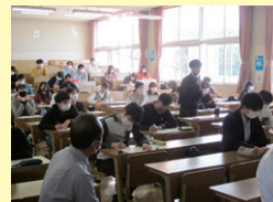
質問も沢山でした