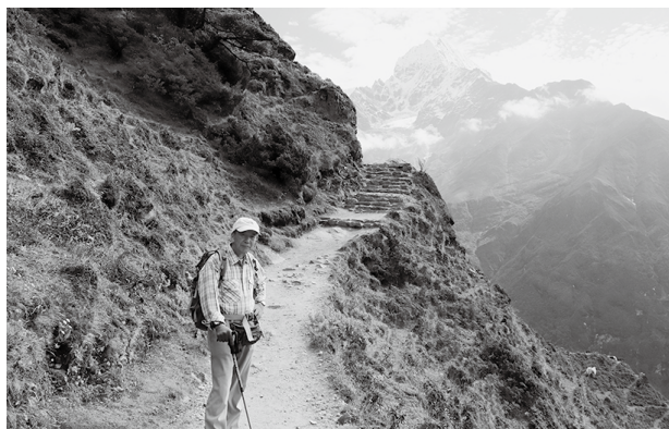
2019年10月 ネパール・ヒマラヤ（標高4,000m）

標高4,500m前後のベースキャンプにたどり着くまでが大変で、そこからキャンプ1、キャンプ2、キャンプ3と設営しながら山頂を目指しますが、必ず登頂に成功